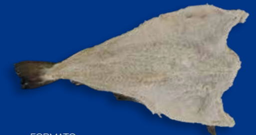
FORMATO Busta monopezzo peso variabile - cartone peso variabile Cartone 20/25 Kg sfuso