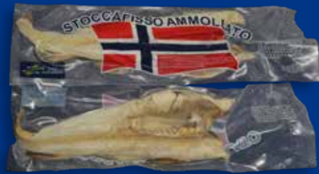
FORMATO Busta monopezzo sottovuoto 1,5 Kg C.A. - cartone peso variabile