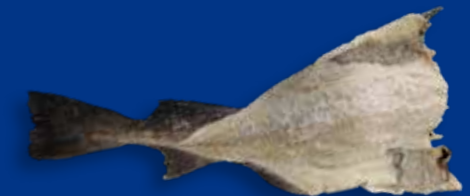
FORMATO Busta monopezzo peso variabile - cartone peso variabile Cartone 20/25 Kg sfuso