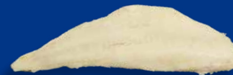
FORMATO Vaschetta 5 Kg - cartone 1 vaschetta x 5 Kg Cartone 25 Kg sfuso