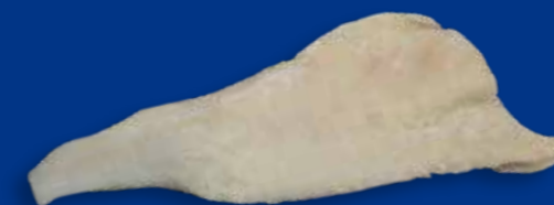
FORMATO Vaschetta 5 Kg - cartone 1 vaschetta x 5 Kg Cartone 25 Kg sfuso