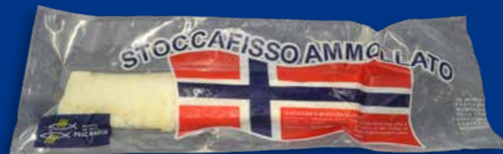
FORMATO Busta monopezzo sottovuoto 600/800 g C.A. - cartone peso variabile