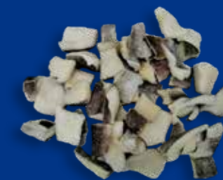
TRANCETTI DI BACCALÀ AMMOLLATO HPP SOTTOVUOTO

FORMATO Busta sottovuoto 2,5 Kg - Cartone 2 buste x 2,5 Kg