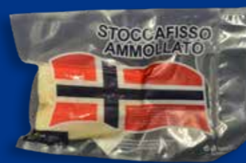
FORMATO Porzione sottovuoto 300/400 g CA - sacchetto 6 porzioni x 300/400 g CA.