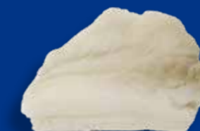
PORZIONE DI FILETTO DI BACCALÀ AMMOLLATO HPP SOTTOVUOTO

FORMATO Porzione sottovuoto 300/400 g CA. - sacchetto 6 porzioni x 300/400 g CA.